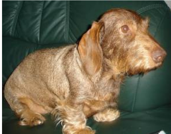
Borsti´s Schwester Biene

Hier nun ein paar Verwandte aus der Standardlinie